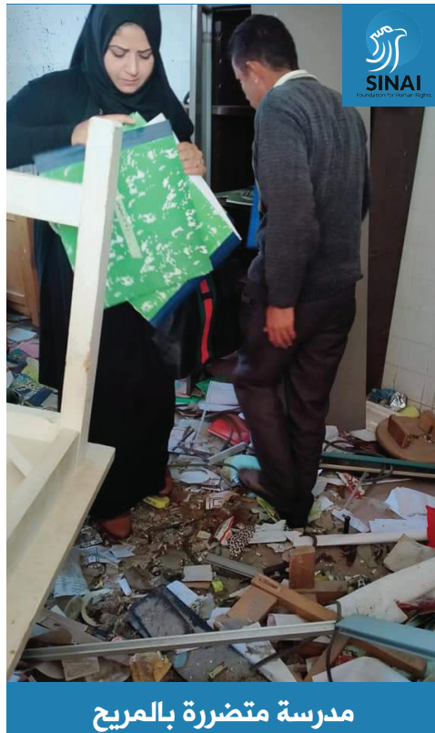
مدرسة متضررة بالمريخ

وبعد معاينة الأضرار التي لحقت بالمدارس من قبل لجان وطواقم تفتيش، تابعة لإدارة "بئر العبد" التعليمية، اتضح لتلك اللجان تباين في حجم الأضرار بين آثار ارتطام طلقات الرصاص على جدران